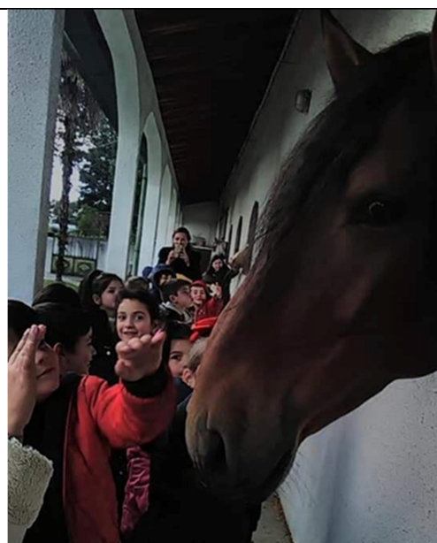
Centro Hípico e Turístico do Vale do Sousa: 21 e 28/11/2019

Para a distribuição destas visitas pelos diferentes Agrupamentos de escolas foi tido em conta o número de beneficiários do projeto dos 1.º, 2.º, 5.º 6.º e 7.º anos tendo sido feita a seguinte distribuição: