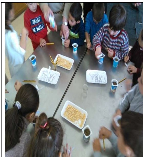
Museu de Penafiel: 21/11/2019