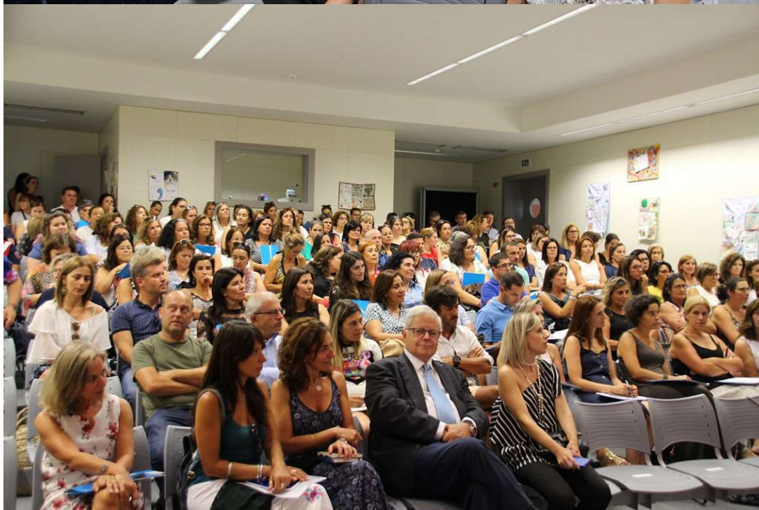
Imagens da sessão de abertura do ano letivo – 6 de setembro de 2019