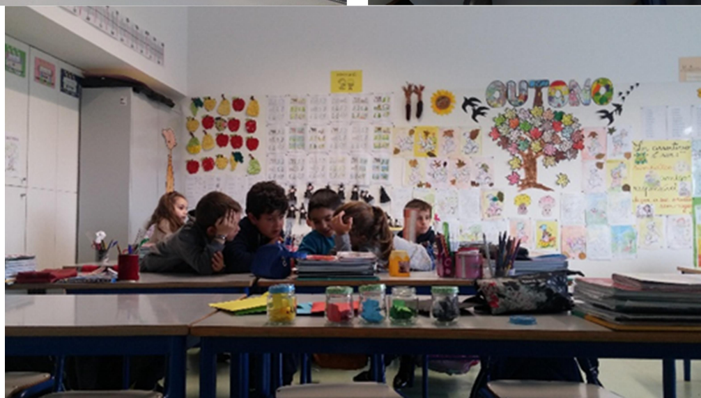
Fotografias ilustrativas das ações do domínio socio emocional 1.º ciclo

Abaixo apresenta-se o resumo com as atividades executadas no 1.º período do ano letivo 2019/2020.